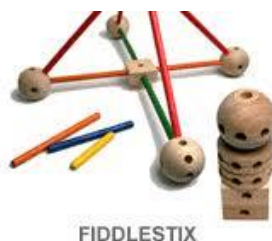
Obr. 5 Ukážka hry Tinkertoy