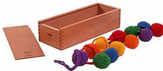
Obr. 1 Fröbelov prvý darček