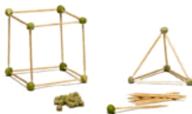
Obr. 4 Hrachová hra